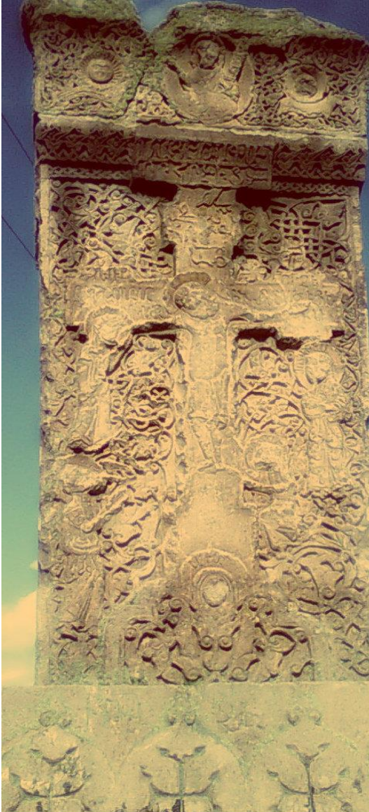
Ամենափրկիչ, 1281, Դսեղ

խարսխավել են պատկերները: Խաչքարը կանգնեցված է երեք խաչերով զարդարված պատվանդանի վրա: