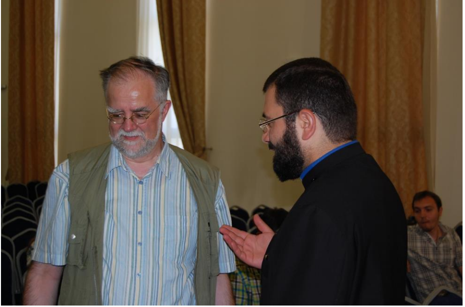
Prof. Tamcke und der Ökumenebeauftragte der Apostolischen Kirche, der zugleich deren Verlagshaus leitet: beim Empfang der Gruppe in Etschmiadsin