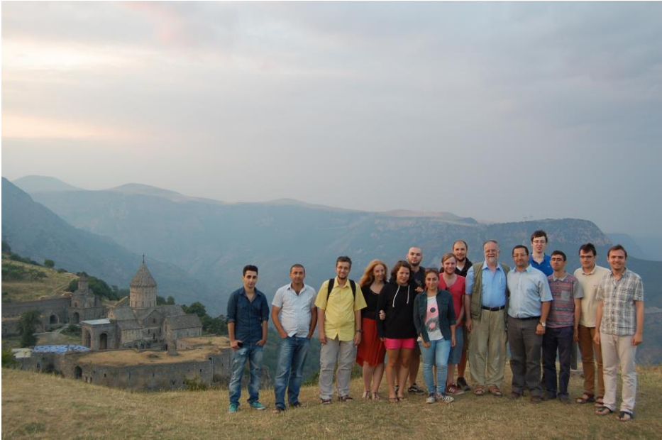
Die Deutsche Gruppe mit den armenischen Studierenden, die sich intensiv an der Durchführung des Workshops beteiligt haben.