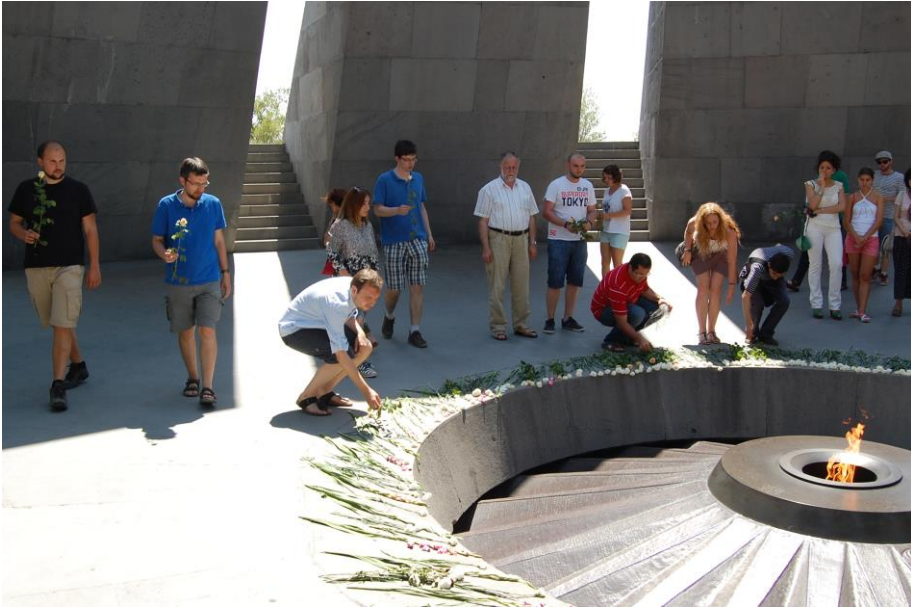
An der Erinnerungsstätte zum Völkermord von 1915 bei der Niederlegung von Blumen