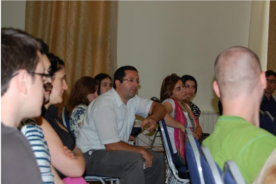
Während der Diskussion im Priesterseminar in Etschmiadsin nach den Vorträgen