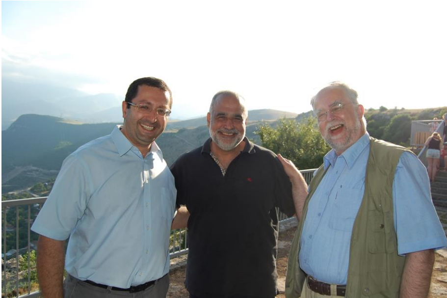
Mit dem ehemaligen Außenminister der Republik Armenien Hovhannissyan (Mitte). Er ist einer der wichtigsten politischen Oppositionsführer und Präsidentschaftskandidat.