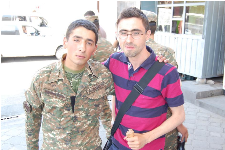
Beim Treffen armenischer Soldaten, die über ihr Erleben an der Grenze zu Aserbaidschan berichten und vor ihrer Entlassung aus dem Militärdienst stehen.