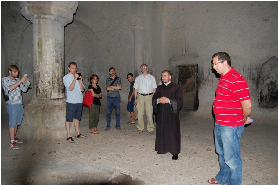
Der einzige Mönch der Armenischen Kirche lebt im Kloster Geghart. Er sang den Studierenden armenische Hymnen vor und erklärte Probleme der monastischen Erneuerung in Armenien.