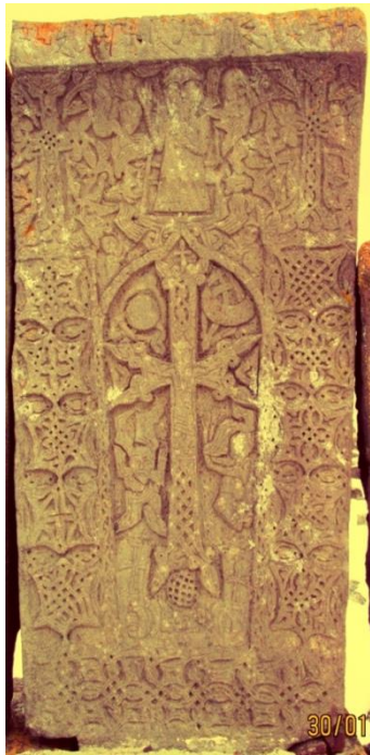
Նորատուս, 16-17րդ դդ

Նորատուսից հայտնի մի խաչքարում ներկայացված է կրկնին խաչյալ Հիսուս Քրիստոս՝ ուղեկցված երկնային լուսանտուներով: Այս պարագայում Փրկչի կերտվածքը կատարյալ չէ, բայց պարունակում է դավանաբանական խորը արմատներ: