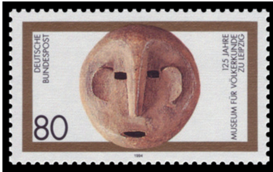
Abbildung 8: Briefmarke Deutsche Bundespost, herausgegeben 1994.

Siehe auch Maske in der Ausstellung Af2052.