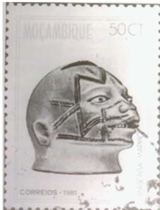
Abbildung 9: Briefmarke aus Mosambik 1981

Siehe auch Maske in der Ausstellung Af2052.