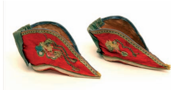
Abbildung 3: Lotoschuhe

te Idealgröße des abgebundenen Fußes lag früher bei 10 cm. Sie wurde jedoch selten erreicht, so dass der Normalfall zwischen 12-15 cm lag (Kürschner 1901:105).