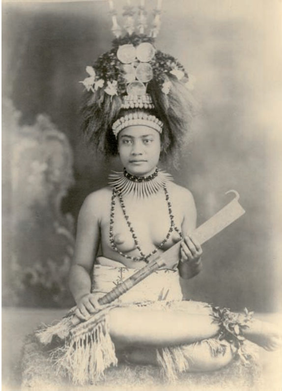
Abbildung 14: Samoanische Zeremonialjungfrau

Schon als kleines Mädchen wurde die angehende taupou sorgfältig auf ihr Amt als Gastgeberin des Dorfes bei Ratsversammlungen, bei der Bewirtung von Besuchern eines Dorfes, bei Tanzveranstaltungen oder Kawa-Trinkzeremonien sowie als Begleiterin des Dorfhäuptlings auf dessen Reisen in andere Dörfer, vorbereitet. Von allen schweren Arbeiten befreit, wurde sie gründlich in den traditionellen