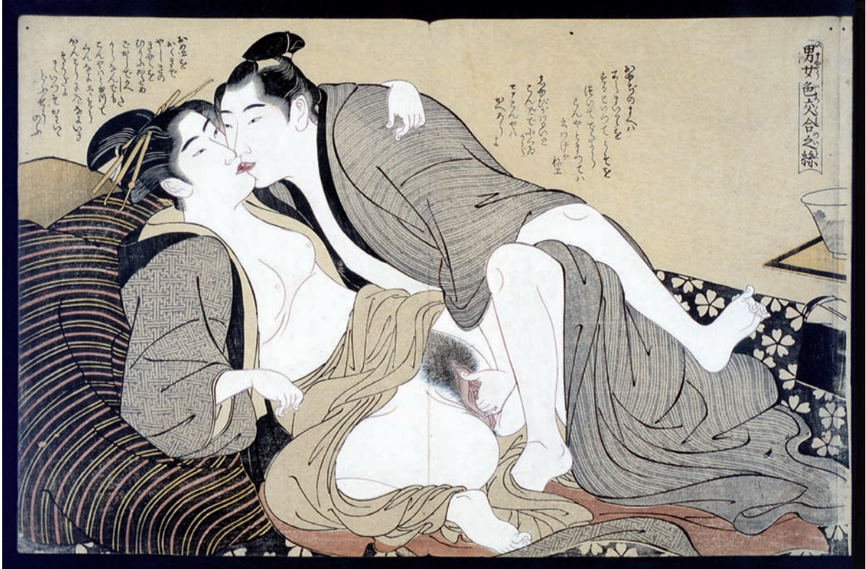
Abbildung 5: Shunga