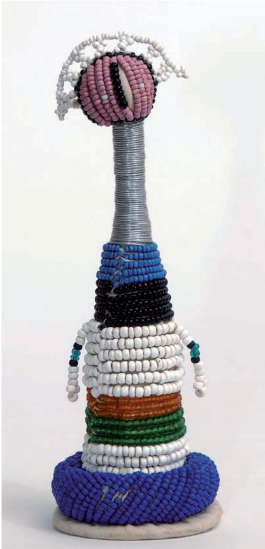
Abbildung 10: Fruchtbarkeitspuppe