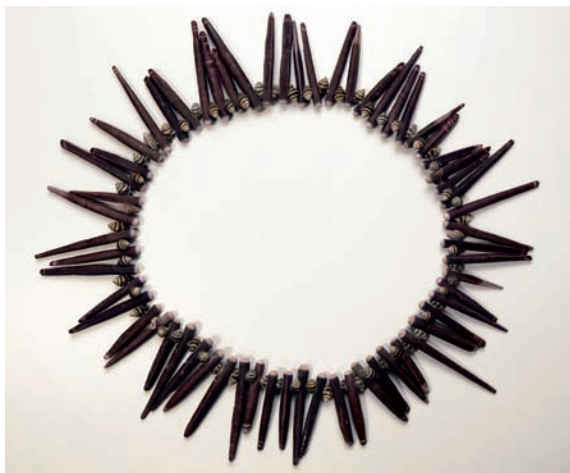
Abbildung 13: Kette aus Seeigelstacheln

nen und betörenden Klang erzeugten. Durch die Geräusche blieb vielen Bewohnern in einem Weiler oder Dorf dieses Liebeswerben im Sinne eines Annäherungsversuches und sich daraus eventuell ergebendem Sex nicht verborgen. Das war auch so gewollt, denn wo und zwischen wem sich gegebenenfalls eine Liebesbeziehung mit nachfolgender Verehelichung anbahnte, sollte auf diskrete Weise signalisiert werden.