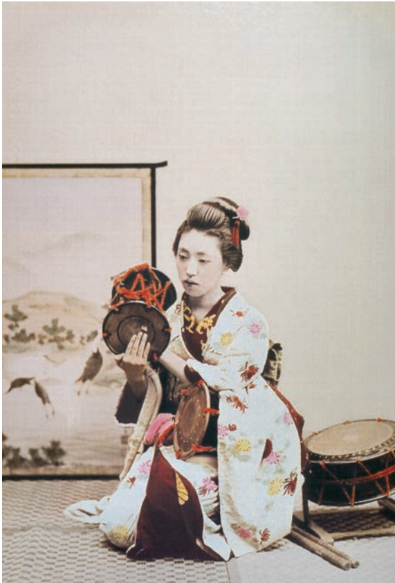
Abbildung 4: Geisha (Ausschnitt)

Hochrangige, gebildete Kurtisanen Japans entwickelten im 17. Jahrhundert erstmals die Idee, Liebe zur Währung in ihren Vergnügungsvierteln zu machen. Die Gefühle und Leidenschaften eines Mannes zu manipulieren und ihn an eine tiefe Ver-