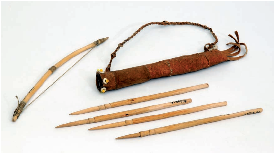
Abbildung 7: Buschmannrevolver