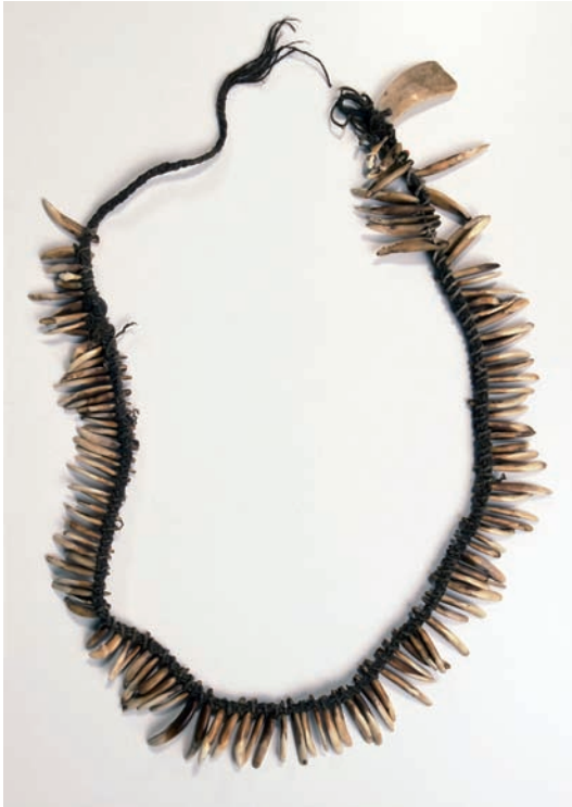
Abbildung 12: Brautgeld

Bei dem ausgestellten Objekt (Oz3761) handelt es sich um einen Schmuckgegenstand der Gargar, der auch als Brautgeld verwendet wurde. Solche Ketten bestehen aus durchbohrten Hundezähnen, die an einer Schnur verflochten sind. Sie wurden von Männern als Hals- und Stirnschmuck und von Frauen ausschließlich als Halsschmuck getragen. Die Stirnbänder bestehen aus drei schmalen Bändern, an denen Nassaschnecken befestigt sind.