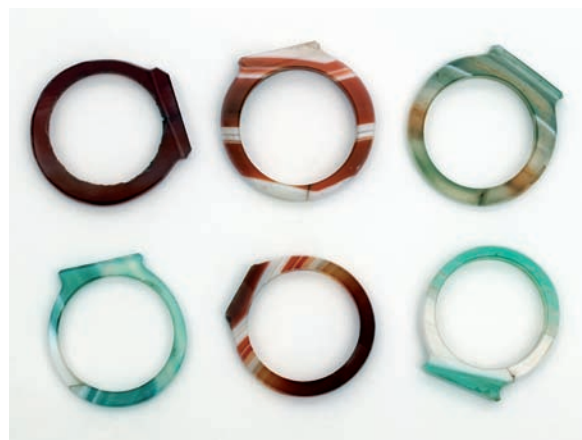
Abbildung 2: Eheringe

Initialen des Ehepartners und das Zeichen der ethnischen Gruppe in den Ring eingraviert. Da die Ringe, die in der Ausstellung zu sehen sind, keines dieser beiden Zeichen aufweisen, können wir sagen, dass sie nie tatsächlich als Eheringe getragen wurden. Im Kastensystem Senegals, das sowohl soziale Stellung wie auch berufliche Orientierung vorgibt, besitzt allein die Kaste der Teugue das Wissen über die Herstellung der Ringe. Steht eine Hochzeit bevor, muss also viel Geld gespart werden, um die Eheringe bei einem Teugue in Auftrag zu geben: ohne Ring, keine Hochzeit. Die Hochzeitsfeierlichkeiten dauern drei Tage an. Am dritten Tag findet nach westlichem Vorbild ein offizieller Ringtausch zwischen den Brautleuten statt. Nach der Hochzeit hat der Ring vor allem für ihre Trägerinnen eine wichtige Bedeutung: Er dient als Zeichen für deren verbesserte soziale Position in der Gesellschaft und bietet dadurch Sicherheit. Die Ehemänner tragen ihre Ringe nach der Hochzeit normalerweise nicht mehr, doch auch ihre soziale Anerkennung steigt mit der Eheschließung erheblich (Mendy, Interview vom 20.4.2012).