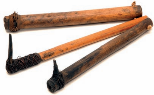
Abbildung 15: Traditionelle Tatauiergeräte

Das Instrument für die Stichtatauierung bestand früher meist aus einem hölzernen oder knöchernen Griff und einer scharfen Spitze aus Stein, heute eher aus Metall (Oz2040, Oz2041, Oz2042). Als Farben konnte Ruß oder pflanzlich gewonnene Farbe dienen, welche oft einen blauen Ton hatte (Deimel 2005:14).