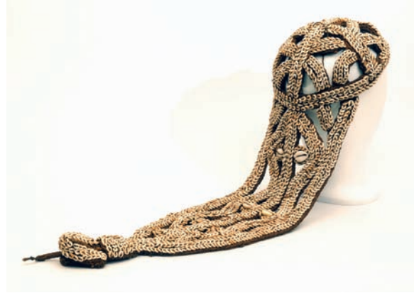
Abbildung 11: Brauthaube

deren Ritualen vom anderen Geschlecht getragen werden, um als Braut verkleidet eine Ahnenfrau darzustellen (Greub 1985:182).