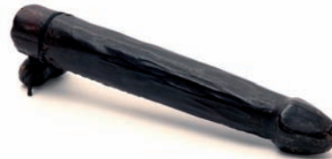
Abbildung 6: Dildo

Fest steht, ob alleine oder zu zweit, zuhause oder auf Reisen, sanft oder wild, aus Neugier oder nur als Mittel zum Zweck: Wie und wann diese Liebespielzeuge zum Einsatz kommen, ist der persönlichen Vorstellungskraft und dem Tatendrang eines jeden einzelnen überlassen. Was Lust verschafft, kann auch Partnerschaften bereichern oder zum eigenen positiven Wohlbefinden beitragen. Hilft es der Liebe, sei es zu sich selbst oder zu anderen, ist alles was glücklich macht erlaubt. Doch wenn es darum geht, das eigene Liebesleben aufzupeppen, gilt das Motto: Alles kann, nichts muss.